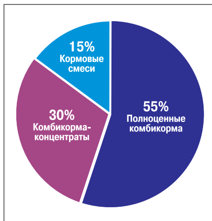
Рис. 1. Структура слагаемых кормов для свиней

Продовольственный уровень потребления продуктов животноводства, соответствующий физиологии