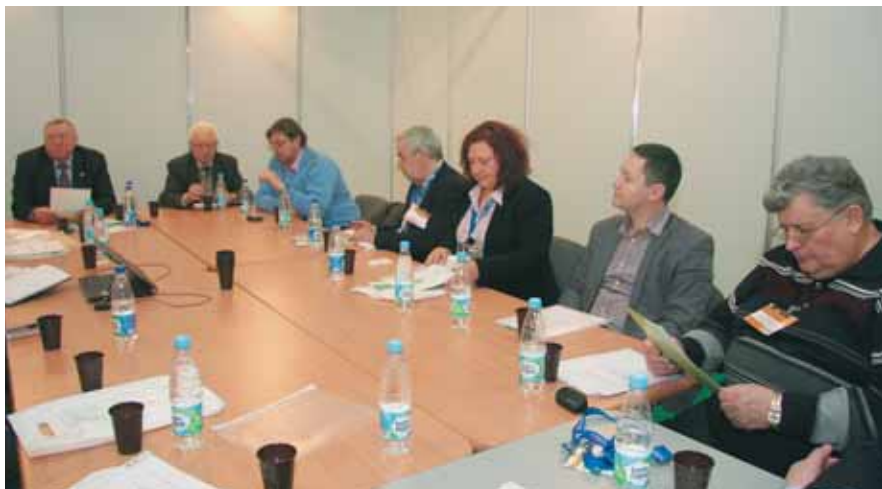
На совете директоров

– Казалось бы, добились высоких привесов, эффективность во много раз выросла, затраты кормов на про-