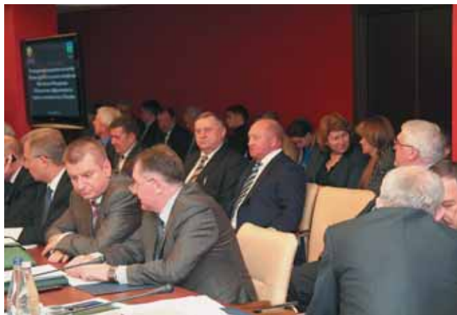
В заседании коллегии МСХ приняли участие руководители крупнейших агрохолдингов