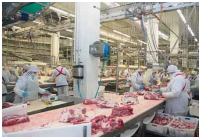
Участники заседания коллегии МСХ побывали на мясоперерабатывающем комбинате СК «Короcha» АПХ «Мираторг»

объектов. Показатели продуктивности животных в СГЦ заметно отличаются от показателей традиционных племязаводов, особенно по многоплодию породы КБ.