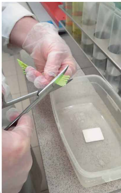
Фото 4. Отрезание ножницами у соломинок: а) верхней части, б) части с ватными пробками над тюбиком

18. Объем дозы для свиноматки при внутриматочном осеменении – 60 мл, для ремонтной свинки при классическом осеменении – 80 мл.