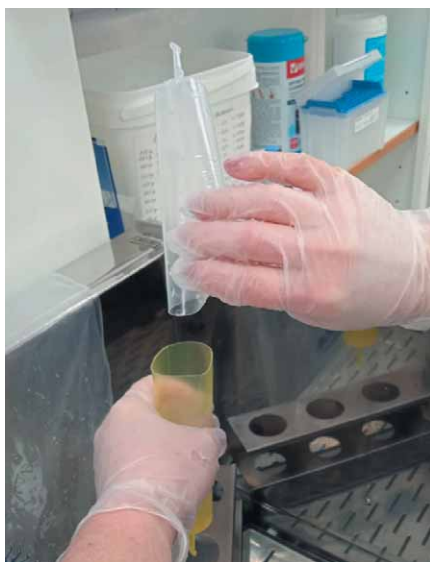
Фото 5. Переливание разбавителя в тюбик с семенем

Целевые показатели эффективности осеменения размороженным семенем составляют 50–70%.