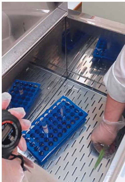
Фото 3. Одновременное погружение соломинок в воду на водяной бане (38°C)

10. Ножницы смочить в спирте (хлоргексидине), протереть, положить на чистую бумагу.